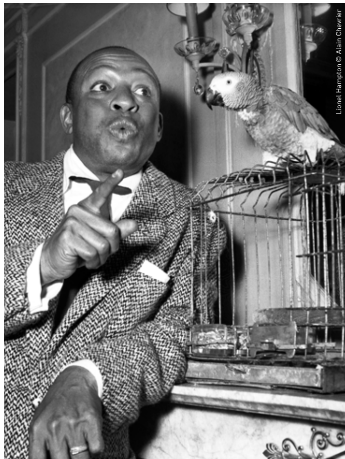
Lionel Hampton

Le Pont des Arts et Galerie de L'Esperluète