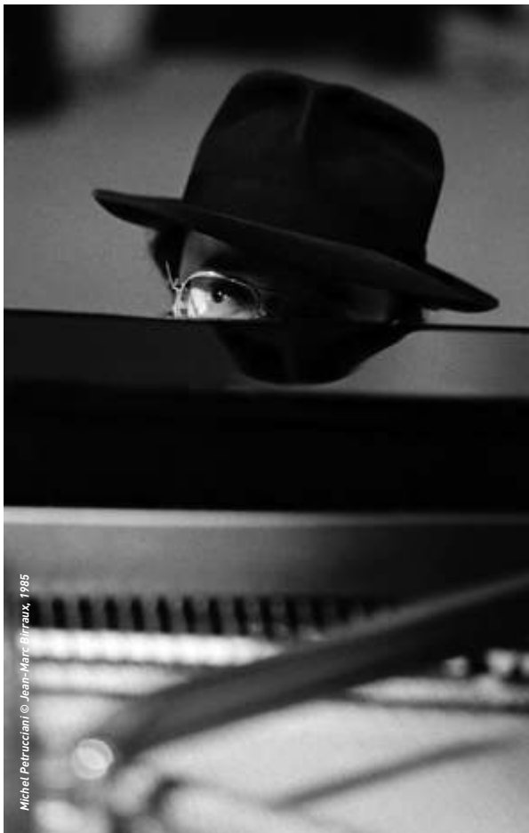
Michel Petrucciani

Le Pont des Arts, Jazz en réseau, Galerie de L'Esperluète