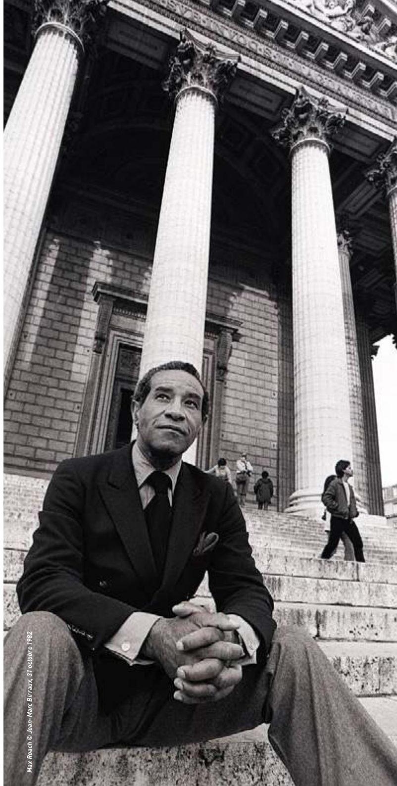
Max Roach

et, parfois, de la distanciation humoristique, il a su saisir des traits de caractère insoupçonnés (un Martial Solal totalement « relax ») ou sublimer des qualités bien connues (le jeu méditatif d'un Keith Jarrett). Un regard original porté sur le monde du jazz. Ce n'est pas si fréquent !