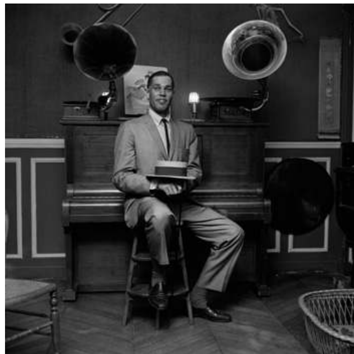
Dexter Gordon, chez JP Leloir, Paris 30 mars 1963

Jean-Pierre Leloir (1931-2010) est connu à l'étranger pour avoir photographié des stars comme Jimi Hendrix ou Bob Dylan. Il est aussi célèbre pour avoir réalisé une des photos culte de la scène musicale française qui réunissait Brel, Brassens et Ferré. Mais pour les amateurs et les professionnels des mondes du jazz il est considéré comme une référence majeure.